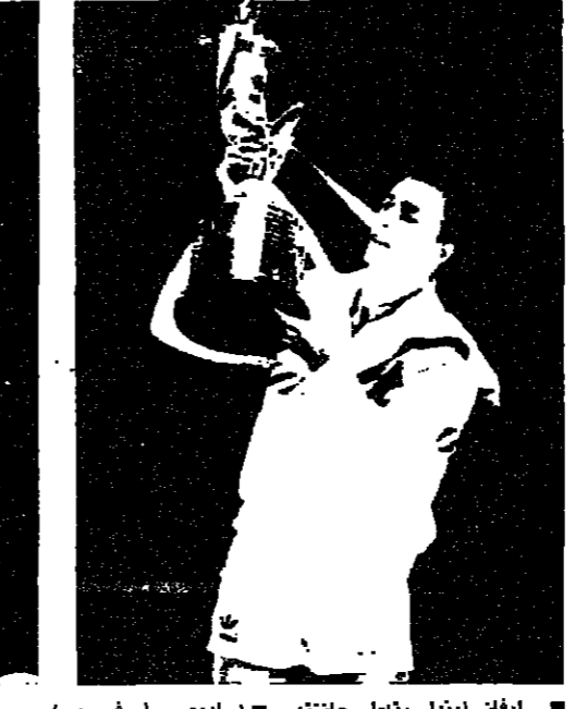
ايفان ليندل يتسلم جائزته